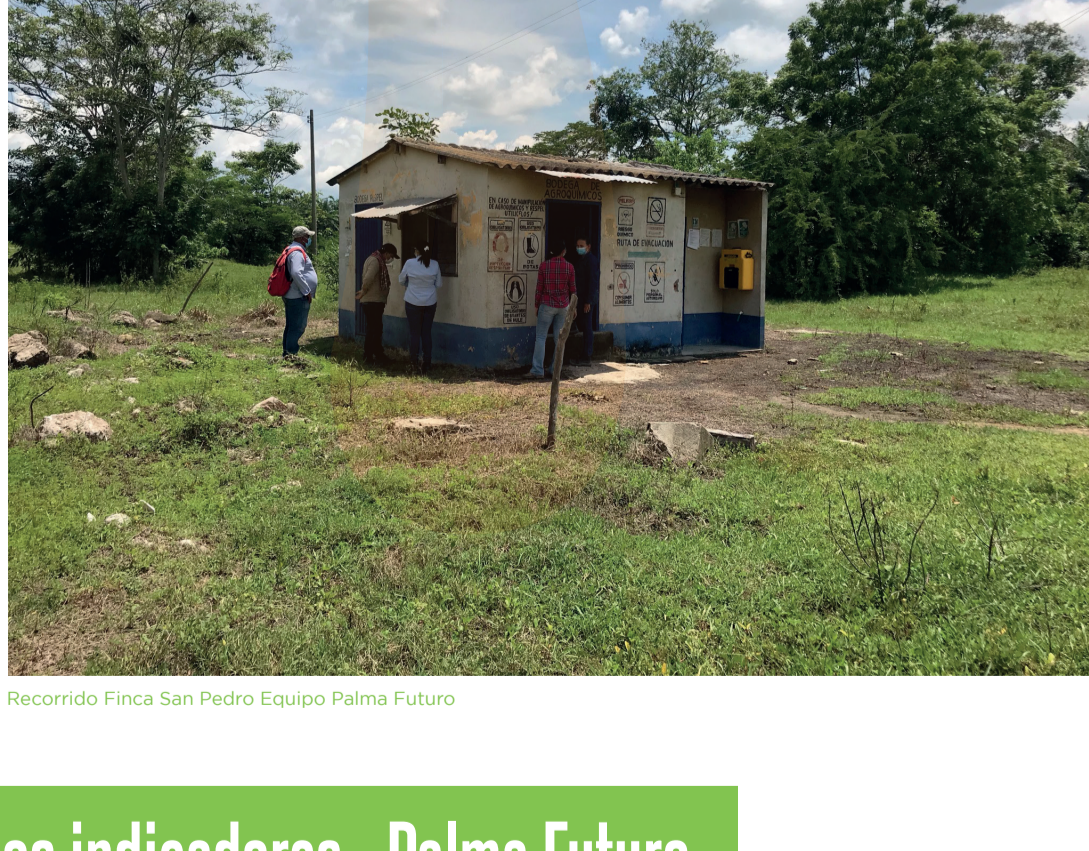
Recorrido Finca San Pedro Equipo Palma Futuro

Se espera que la culminación de las rondas de monitoreo y evaluación que se realizan a partir de septiembre, y continuarán hasta la finalización del proyecto, sirvan como un instrumento para promover la mejora continua en la implementación de Palma Futuro, así como canal para la identificación de prácticas en sistemas de cumplimiento social que puedan ser documentadas y socializadas en los eventos de divulgación del proyecto.