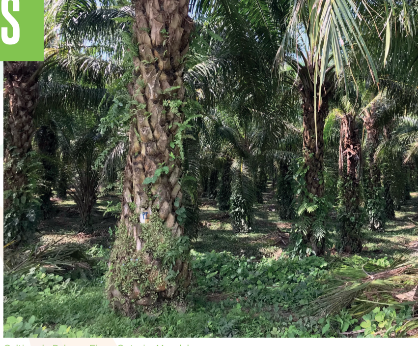
Cultivo de Palma - Finca Ontario, Magdalena

Entre abril y septiembre de 2021, Palma Futuro inició una de las actividades más relevantes para la escalabilidad y sostenibilidad del Proyecto a largo plazo. El ToT por sus siglas en inglés (Training of Trainers) es un programa de formación para los miembros de los EDS, proveedores y partes interesadas en habilidades y conocimientos necesarios para evaluar los riesgos en cada uno de los elementos de los SCS.