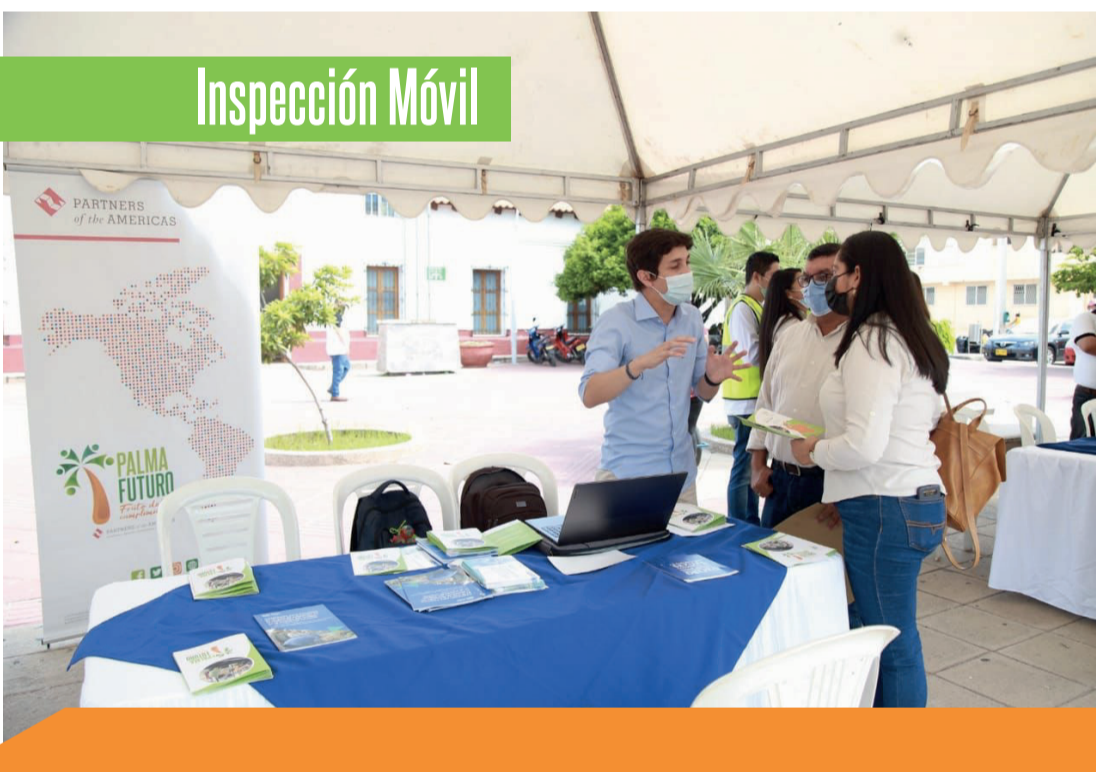
Evento Inspección Móvil Agustín Codazzi, Cesar

Partners of the Americas fue una de las organizaciones invitadas al evento "Inspección Móvil" organizado por el Ministerio del Trabajo de Colombia en el municipio de Agustín Codazzi, Cesar.