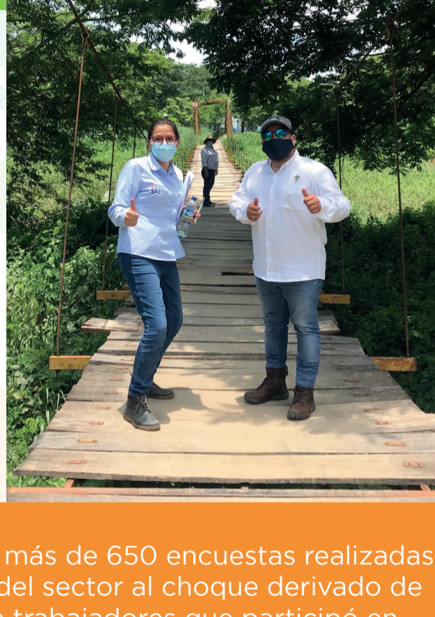
Equipo Palma Futuro y extractora Aceites y Palmaceites S.A. Finca San Pedro, Magdalena

El 18 de septiembre de 2021 fue realizado el webinar "Condiciones laborales y COVID-19 en el sector del aceite de palma: Retos y oportunidades en Colombia y Ecuador". La presentación se centró en los efectos de la pandemia del COVID-19 en las condiciones socioeconómicas, laborales, de salud y de acceso a la información de trabajadores de las plantas extractoras y fincas proveedoras en Colombia y Ecuador.