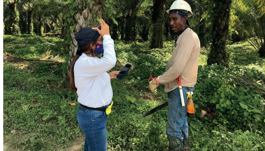
Entrevista con trabajadores - Finca La Carmela, Magdalena

Posteriormente, en una segunda reunión privada, el staff de Palma Futuro tuvo la oportunidad de sostener una conversación más extensa con el equipo de la extractora Palmas del Sicarare, en la cual se acordó generar un espacio durante el último trimestre de 2021 para realizar la revisión y potencial documentación de buenas prácticas en Sistemas de Cumplimiento Social que puedan estar dándose en la extractora.