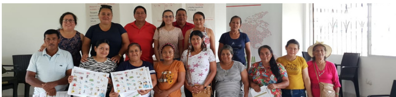
Taller de Sensibilización en trabajo infantil y trabajo forzoso, Joya de los Sachas

El 12 y 13 de diciembre de 2022, Palma Futuro y el Ministerio de Trabajo del Ecuador realizaron actividades de sensibilización sobre trabajo infantil y trabajo forzoso, en las comunidades de Joya de los Sachas y Shushufindi , como parte de las acciones implementadas con los CC en la Amazonía del Ecuador. Asimismo, el 21 de diciembre de 2022, Palma Futuro implementó actividades de sensibilización en trabajo infantil y trabajo forzoso en las comunidades de La Concordia, Flor del Valle y en el recinto El Rosario , en la provincia de Santo Domingo de los Tsáchilas.