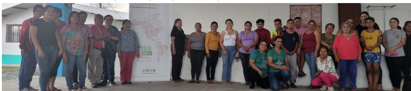
Taller de Sensibilización en trabajo infantil y trabajo forzoso, comunidades Santo Domingo de los Tsáchilas