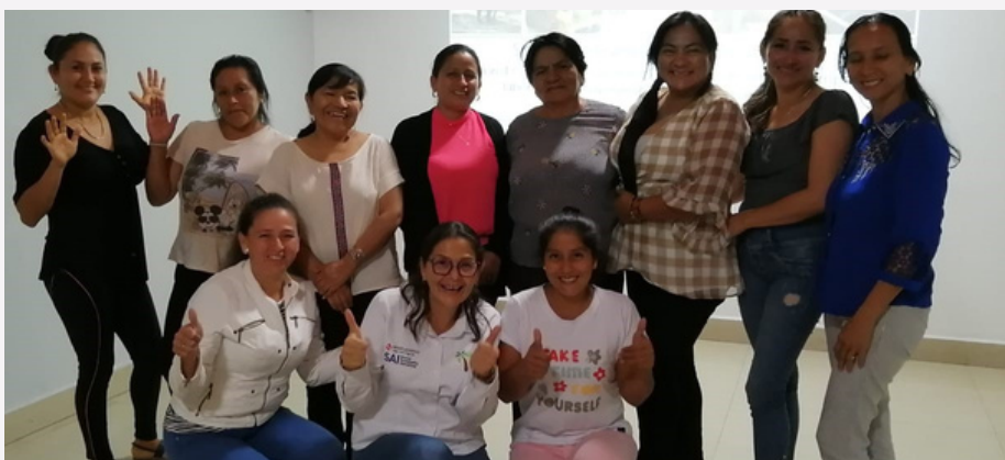
Trabajo en grupo con mujeres palmicultoras de Joya de los Sachas