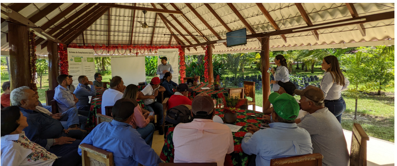
Jornada de sensibilización con proveedores y socios de Palmagro S.A.

El 12 de diciembre de 2022, Palma Futuro brindo un taller de capacitación de cuatro horas sobre la importancia de implementar el Sistema de Cumplimiento Social (SCS) , con el equipo directivo de fincas proveedoras de fruta asociadas a Palmagro . El taller se llevó a cabo en la finca Rancho Ariguani y contó con 23 asistentes entre dueños, gerentes y líderes de sostenibilidad de fincas proveedoras de Palmagro . En esta oportunidad los asistentes recibieron una capacitación sobre las ocho categorías del Sistema de Gestión y los nueve elementos de Desempeño Laboral. La jornada de sensibilización permitió el intercambio de experiencias, inquietudes y oportunidades para fortalecer el compromiso gerencial de fincas proveedoras con la implementación del SCS en el sector.