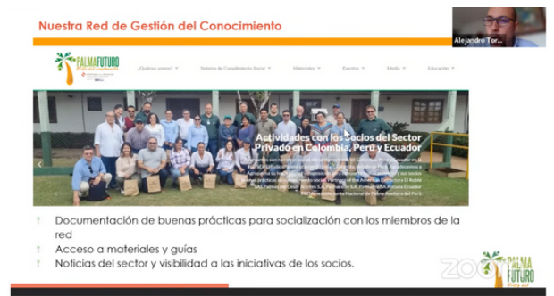
WEBINAR Herramientas y buenas prácticas en la lucha contra el trabajo infantil y el trabajo forzoso