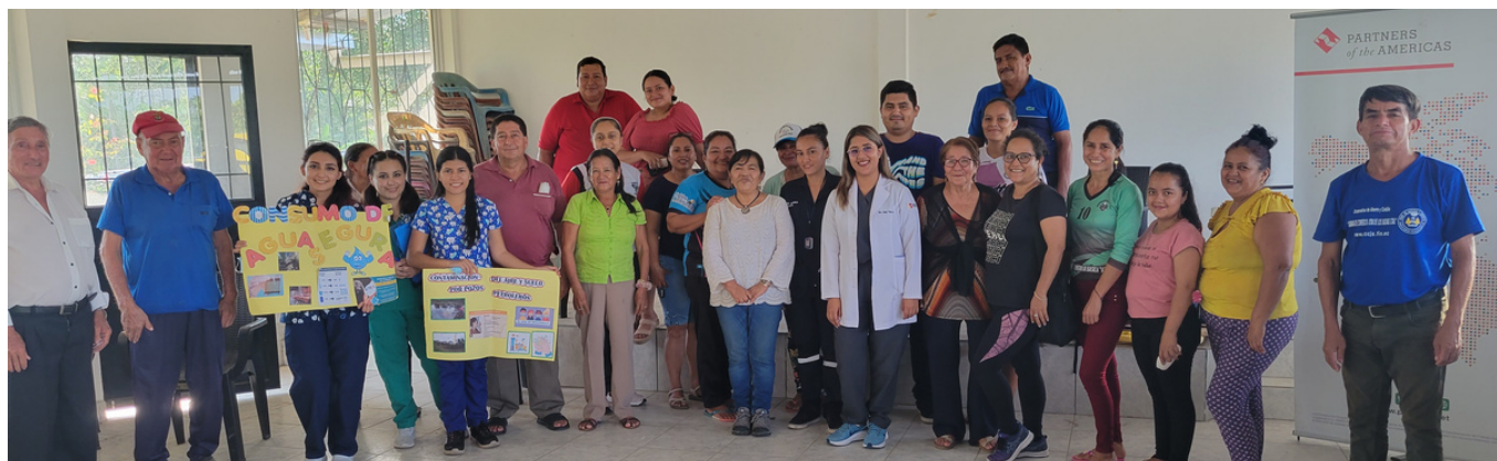
Taller de Primeros Auxilios, Círculo Comunitario 10 de Agosto, Joya de los Sachas