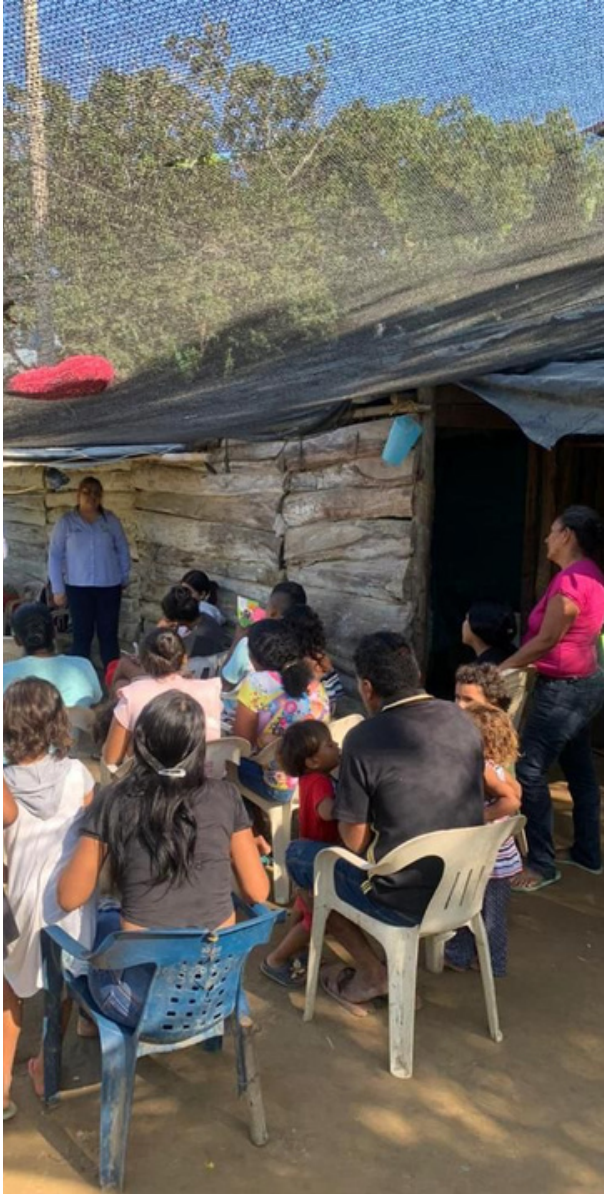
Conformación del Círculo Comunitario Colorado