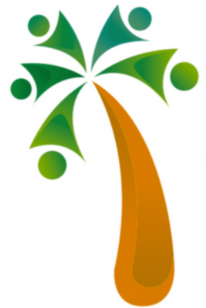
Taller de capacitación 'Ruta hacia la formalidad del empleo'

Los días 13 y 14 de diciembre de 2022, Palma Futuro realizó un taller de capacitación sobre herramientas para la formalización de trabajadores en finca y el adecuado registro de riesgos de salud y seguridad en el trabajo.