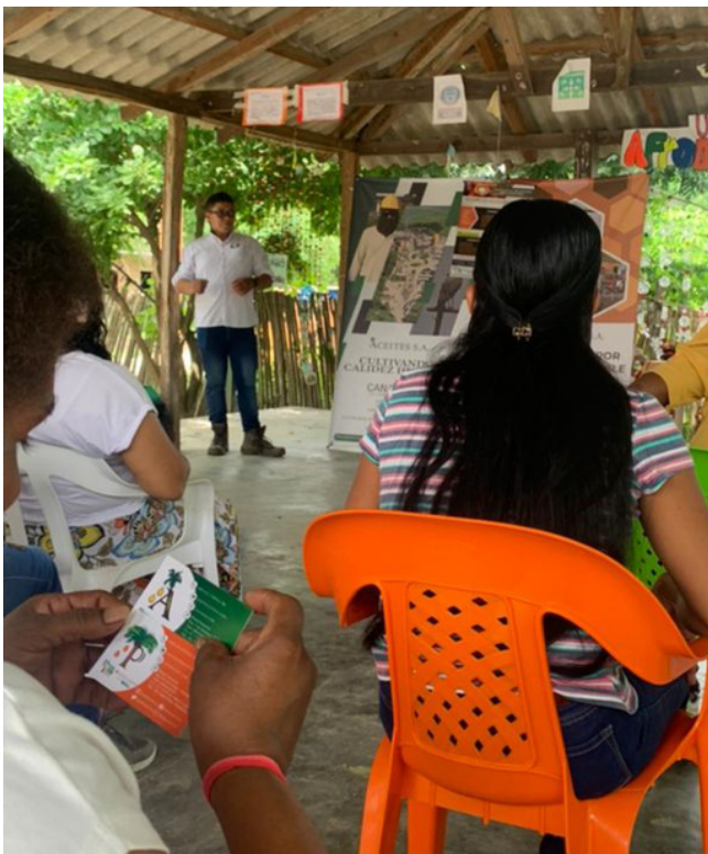
Socialización de los canales de PQRSF con comunidades, Zona Bananera, Magdalena

En línea con las mejores prácticas del Sistema de Gestión , el pasado 11 de enero de 2023, las Extractoras Aceites S.A y Palmaceite S.A , presentaron su video tutorial para interponer Peticiones, Quejas, Reclamos, Sugerencias o Felicitaciones (PQRSF) . El video, disponible en YouTube, cuenta con lenguaje de señas para facilitar la accesibilidad y se difundió por sus canales institucionales, en redes sociales como Facebook, Twitter, LinkedIn y con las comunidades en su área de influencia.