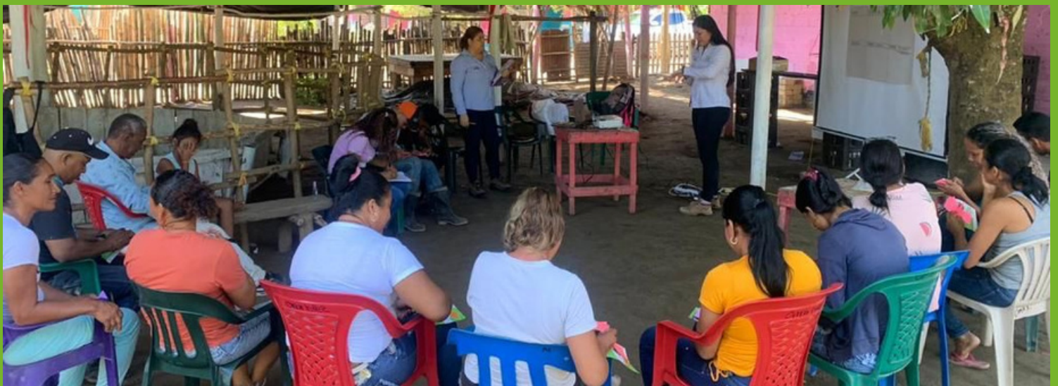
Conformación del Círculo Comunitario Carital

Adicionalmente, y por pedido de la comunidad, el 9 de diciembre de 2022, se realizó la parte teórica del curso con el SENA sobre manejo de cultivos de palma híbrida con miembros de la comunidad en los corregimientos y veredas de: San Pedro, La Colombia, La Bogotana, La Cabañita y las Flores, en el Departamento del Magdalena.