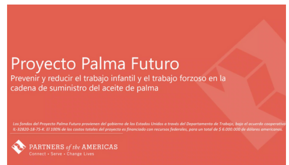
Participación de Palma Futuro en la Reunión General de la Red Colombia contra el Trabajo Infantil