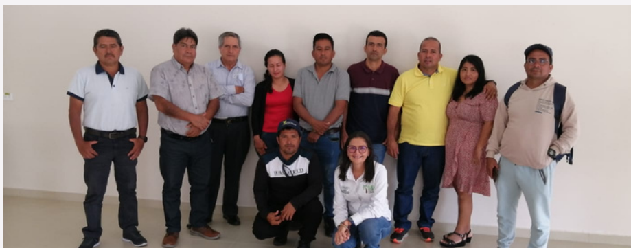
Actividades desarrolladas con el grupo de proveedores de ANCUPA en Shushufindi

Los días 5 y 6 de diciembre de 2022, en las comunidades de Joya de los Sachas y Shushufindi, en la Amazonía ecuatoriana, Palma Futuro llevó a cabo actividades de capacitación relacionadas con la implementación del SCS. El taller se realizó con partes interesadas y socios del Grupo Palmas Arriba y con proveedores de la Asociación Nacional de Cultivadores de Palma Aceitera (ANCUPA) . El taller abordó temas de evaluación, priorización de riesgos en sus plantaciones y la necesidad de involucrar a las partes interesadas y socios, mediante ejercicios prácticos de aplicación.