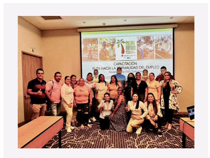
Taller de capacitación 'Ruta hacia la formalidad del empleo'

En esta capacitación participaron 25 personas del Equipo de Desempeño Social (EDS) de la Extractora El Roble , capacitadores en formación y parte del equipo de sostenibilidad de Cenipalma . Con estas actividades se busca fortalecer las capacidades de los proveedores de fruta para implementar el SCS y garantizar la sostenibilidad de los resultados estratégicos del proyecto Palma Futuro .