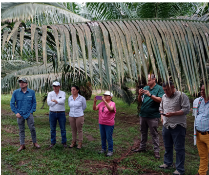
Participantes de la Gira de Estudio

Durante la primera semana de marzo de 2023, Palma Futuro llevó a cabo una semana de trabajo en Ecuador en la que se realizó un Taller Sectorial y una Gira de Estudio . El Taller Sectorial se llevó a cabo en Shushufindi el 1 de marzo y se centró en conocer la perspectiva de los productores independientes de palma aceitera de pequeña escala, frente a los retos y oportunidades que han identificado en la implementación del SCS . El Taller contó con la participación de los SSP de Palma Futuro en Colombia y Ecuador, así como con proveedores de estos. Los asistentes participaron de un conversatorio enfocado en la implementación del SCS a un bajo costo, pero de manera efectiva; la Seguridad y Salud en el Trabajo en las fincas y el mejoramiento de las condiciones laborales y el trabajo decente en las fincas productores de palma de aceite . Adicionalmente, la jornada concluyó con unas mesas de trabajo en las que los asistentes pudieron intercambiar experiencias frente a los temas abordados en el conversatorio.