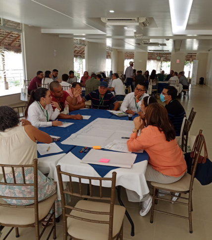
Mesas de Trabajo durante el Taller Sectorial