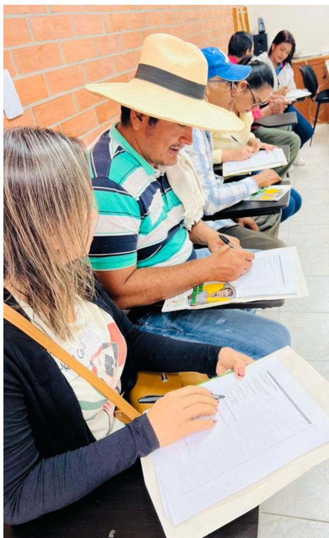
Capacitación en SCS a proveedores de Palmas del Cesar

Con el fin de fortalecer el cumplimiento social en la cadena de suministro de Palmas del Cesar , el 22 de febrero de 2023, Palma Futuro capacitó en el SCS a 30 pequeños y medianos proveedores de fruta de la extractora. Con actividades lúdicas los participantes recibieron una capacitación sobre los conceptos relacionados a las categorías del Sistema de Gestión y los elementos de Desempeño Laboral , presentándoles una introducción al SCS. Con esta capacitación se busca sensibilizar a los productores de fruta para que inicien el proceso de fortalecimiento de su SCS.