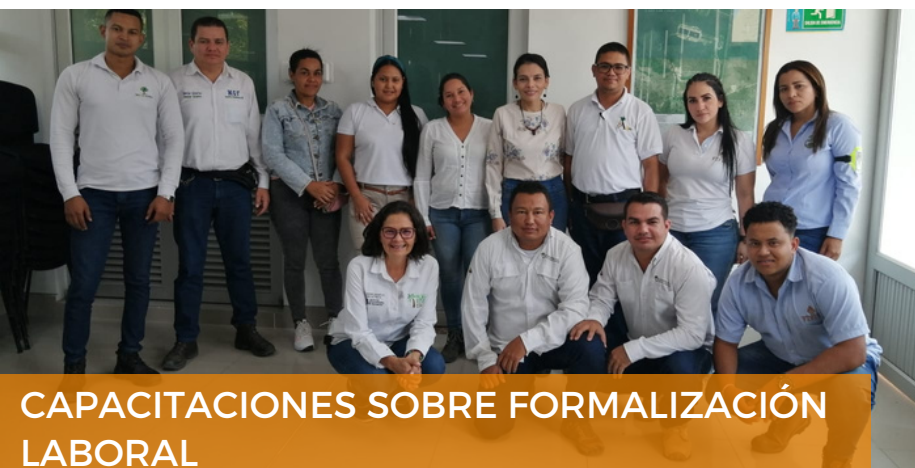
CAPACITACIONES SOBRE FORMALIZACIÓN LABORAL