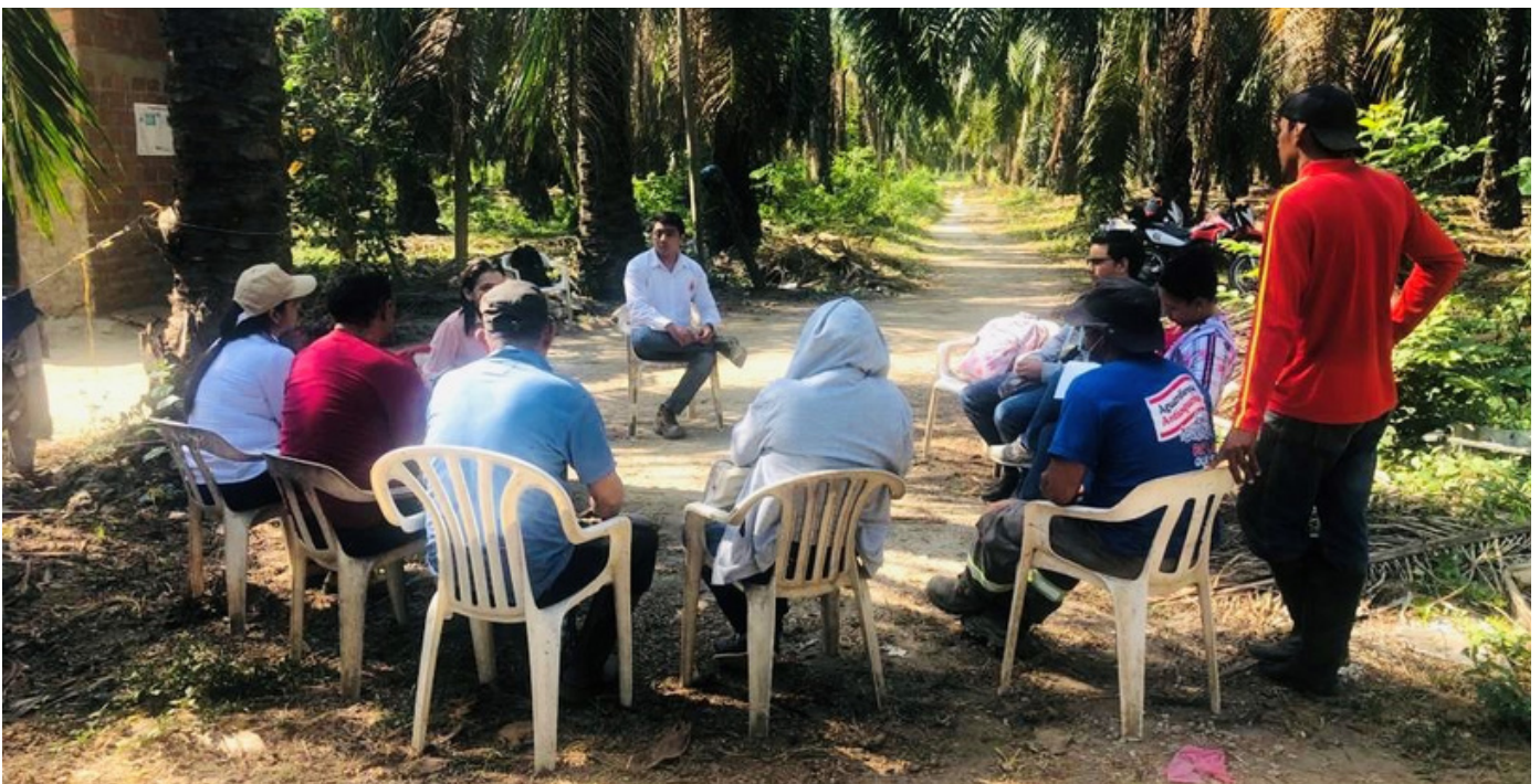
Capacitación sobre los elementos de Desempeño Laboral con trabajadores de la Finca Los Olivos en Magdalena, Colombia

Como parte del acompañamiento técnico que brinda Palma Futuro , durante los meses de febrero y marzo de 2023, se realizaron visitas de seguimiento a la implementación de las acciones de mejora en fincas proveedoras de fruta de la Extractora El Roble , en el departamento del Magdalena. Durante estas visitas, trabajadores de la Extractora El Roble que participaron en los entrenamientos del programa Formador de Formadores (ToT por sus siglas en inglés) de Palma Futuro , realizaron capacitaciones a siete proveedores de fruta sobre los elementos de Desempeño Laboral que componen el SCS.