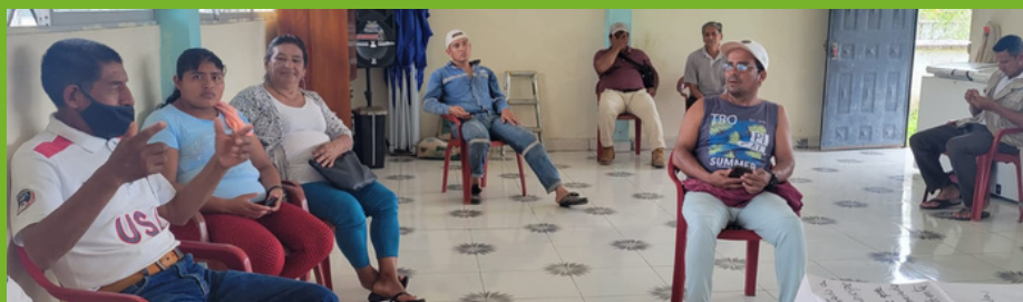
Taller de elaboración de propuestas con el CC de Miss Ecuador

En el marco de las acciones lideradas por los CC de Miss Ecuador y Las Cañitas , en Shushufindi, Ecuador, Palma Futuro llevó a cabo el pasado 27 de febrero de 2023, la primera sesión de un taller de capacitación sobre formulación de propuestas , con el fin de que las comunidades aumenten su capacidad de incidencia y de relacionamiento con diferentes partes interesadas, como las autoridades o las empresas que operan en la zona. El contenido del taller aborda la redacción de una propuesta, la definición de objetivos y metodologías, y la formulación de presupuestos.