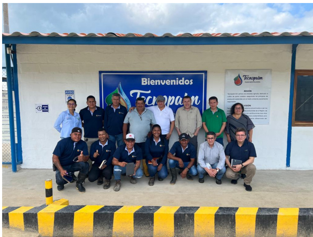
Equipo de trabajo de Tecnopalm durante la visita independiente

Como parte de las actividades de Palma Futuro relacionadas con la implementación del SCS, el equipo realizó una visita independiente a la empresa palmicultora Tecnopalm , ubicada en San Lorenzo, provincia de Esmeraldas. La visita permitió conocer los procesos asociados al Sistema de Gestión y buenas prácticas laborales que se implementan en campo, para evaluarlas y recomendar acciones de mejora continua . Estas actividades se llevaron a cabo con la participación de un miembro del equipo de Formador de Formadores que ha sido capacitado por Palma Futuro .