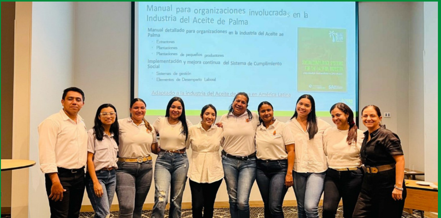
Entrenamiento en auditoría social con trabajadores de la Extractora El Roble

El pasado 16 y 17 de marzo de 2023, Palma Futuro realizó el primer entrenamiento de auditores sociales internos a 12 trabajadores de la Extractora El Roble , en Santa Marta, Magdalena. En este entrenamiento se abordaron temas asociados a la auditoría social como: la norma ISO 19011, los procesos de planeación de la auditoría, apertura, revisión de documentos, entrevistas, triangulación de información y el cierre de una auditoría.