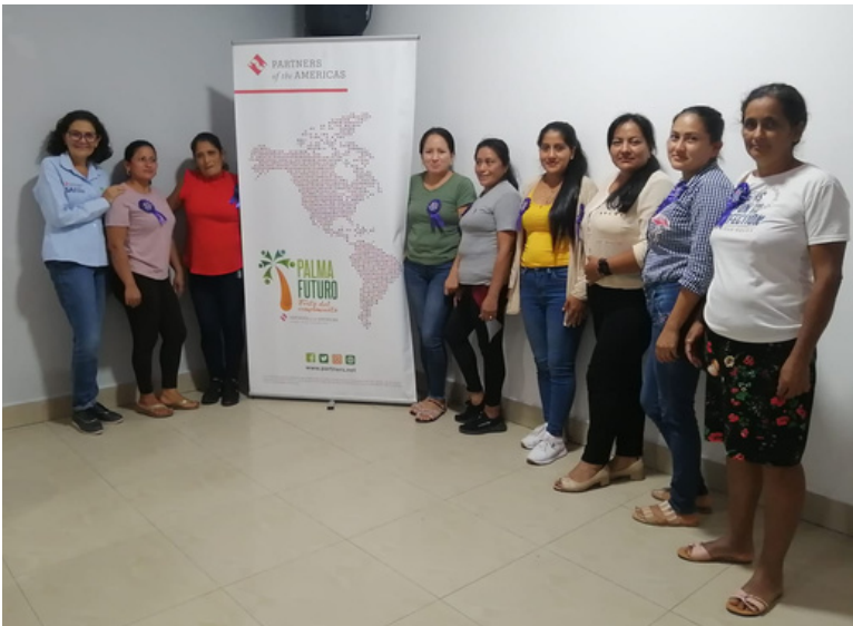
Capacitación con el grupo Palmas Arriba en Joya de los Sachas, Ecuador

Con el fin de fortalecer la implementación y los conocimientos del SCS y mejorar los procesos gestión de los productores palmeros de pequeña escala, Palma Futuro realizó en marzo de 2023 sesiones de capacitación sobre monitoreo, acciones correctivas, acciones de remediación e informes de desempeño , mediante ejercicios de aplicación con el grupo de Palmas Arriba en Joya de los Sachas, provincia de Orellana y un grupo de afiliados de ANCUPA en Shushufindi, ubicados en la provincia de Sucumbíos en Ecuador.