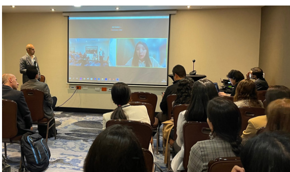
Presentación de Palma Futuro y de la Extractora El Roble

La Feria Comercial también contó con la participación de la Fundación Pasos Libres, la Cámara de Comercio de Bogotá, Global Reporting Initiative, Ulula y la Fundación Ideas para la Paz. Durante la jornada, también se llevó a cabo un panel de debate denominado 'Prácticas de negocios responsables en Colombia: la importancia de analizar políticas y prácticas y cómo hacerlo' en el que participaron representantes de Pacto Global Red Colombia, Business for Social Responsibility (BSR), la Asociación Nacional de Industriales (ANDI) y la Cámara de Comercio de Bogotá.