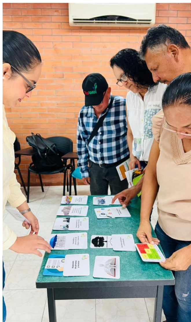
Capacitación en SCS a proveedores de Palmas del Cesar