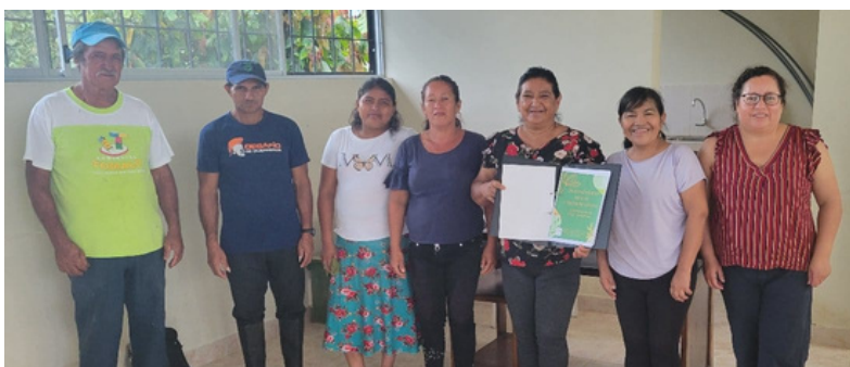
Taller de elaboración de propuestas con el CC de Las Cañitas

Esta primera sesión contó con la participación de 10 líderes de los CC , a quienes se les entregó el diagnóstico participativo elaborado por los CC con el apoyo técnico de Palma Futuro . Con base en estos diagnósticos, el CC de Las Cañitas identificó la necesidad de trabajar en una propuesta para estructurar un emprendimiento que ayude a mitigar problemas de seguridad alimentaria en la comunidad. Por otra parte, el CC de Miss Ecuador , identificó la necesidad de trabajar en una propuesta para el mejoramiento de la calidad del agua (potabilidad), y una propuesta para aminorar los efectos de plagas y otras afectaciones a los cultivos de palma, con participación de la comunidad.