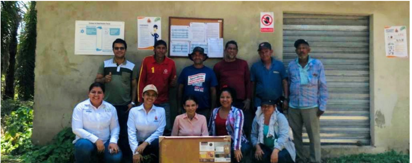
Visita de seguimiento a plan de acción de la Finca Los Olivos en Magdalena, Colombia