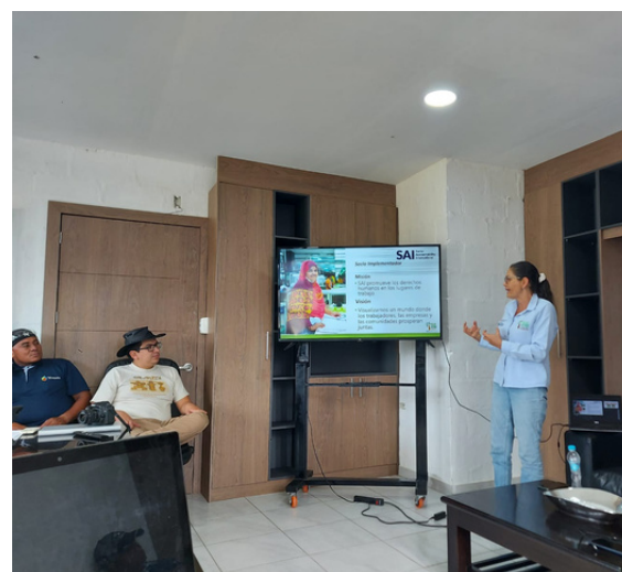
Presentación del SCS a Tecnopalm

Como parte de las actividades de Palma Futuro relacionadas con la implementación del SCS, el equipo realizó una visita independiente a la empresa palmicultora Tecnopalm , ubicada en San Lorenzo, provincia de Esmeraldas. La visita permitió conocer los procesos asociados al Sistema de Gestión y buenas prácticas laborales que se implementan en campo, para evaluarlas y recomendar acciones de mejora continua . Estas actividades se llevaron a cabo con la participación de un miembro del equipo de Formador de Formadores que ha sido capacitado por Palma Futuro .