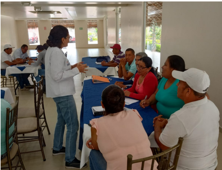
Trabajo en equipo con afiliados a ANCUPA en Shushufindi, Ecuador