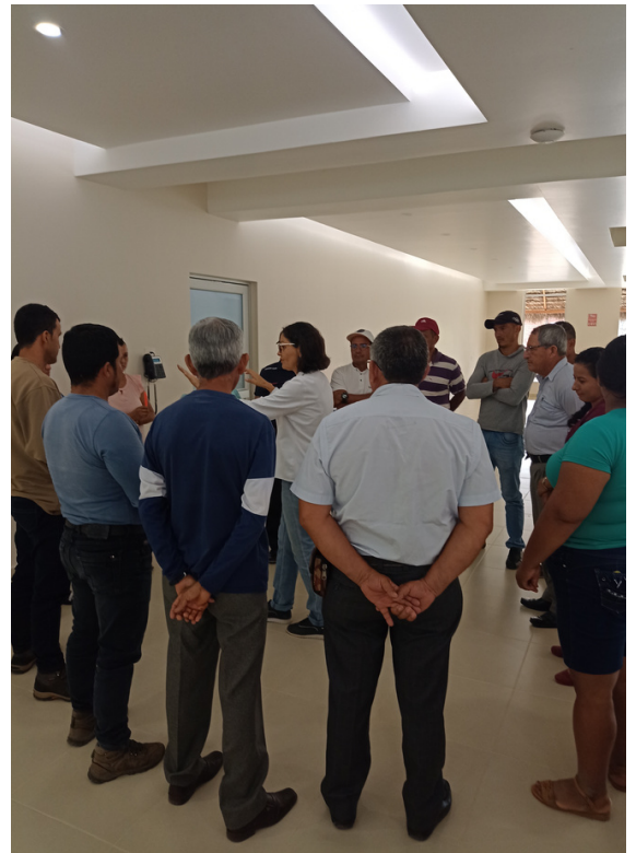
Trabajo en equipo con afiliados a ANCUPA en Shushufindi, Ecuador