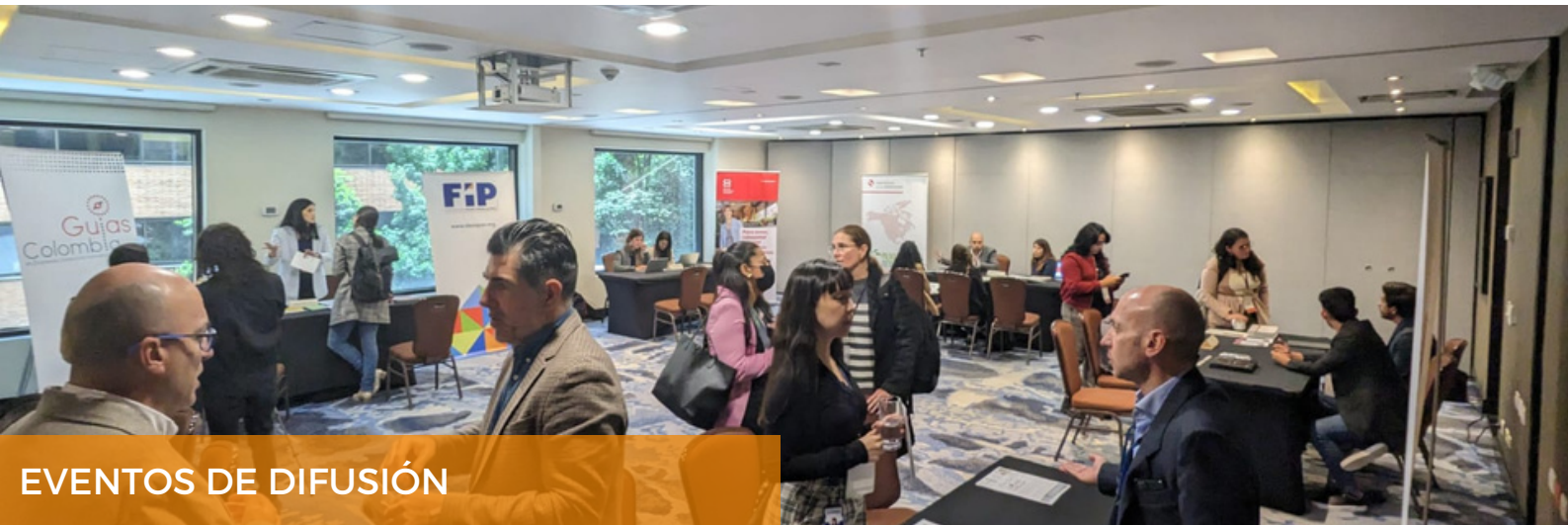
EVENTOS DE DIFUSIÓN

Palma Futuro realizó talleres de capacitación en formalización laboral con 45 trabajadores de los Socios del Sector Privado en Colombia.