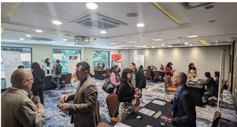
Participación de Palma Futuro en la Feria Comercial organizada por la Fundación Thomson Reuters