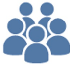
Red de conocimiento