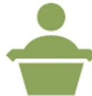
Talleres y foros regionales