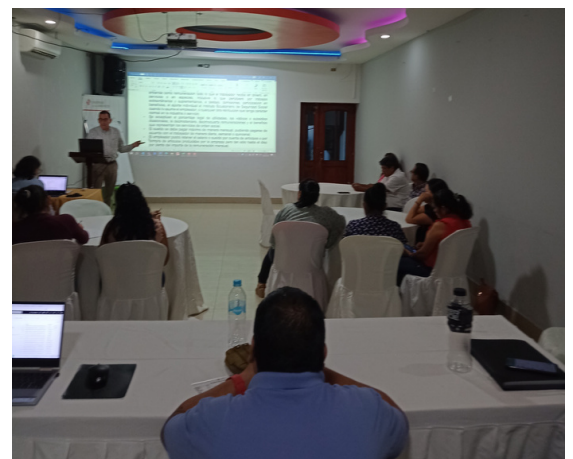
Capacitación sobre legislación laboral con el grupo Palmas Arriba