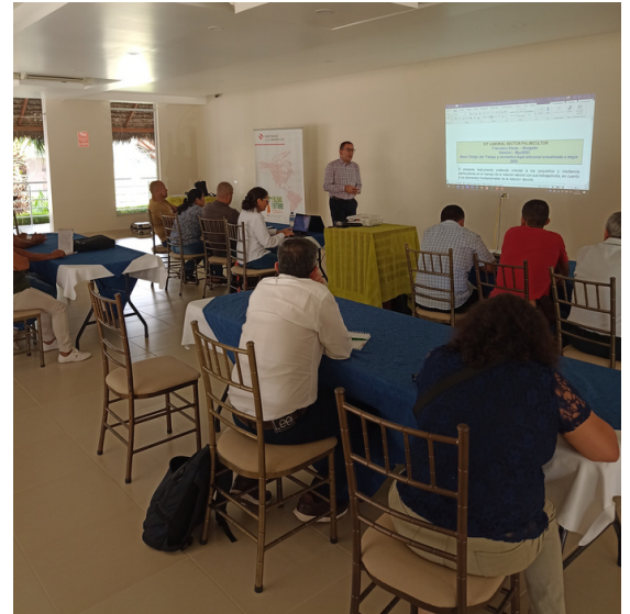
Capacitación sobre legislación laboral con afiliados a ANCUPA

En la semana del 29 de mayo al 2 de junio de 2023, Palma Futuro llevó a cabo sesiones de capacitación en temas de legislación laboral ecuatoriana para productores de aceite de palma de pequeña escala , mediante la participación y asesoría de un experto laboral con experiencia en asuntos laborales relacionados con el sector palmicultor. Las sesiones se realizaron en Shushufindi con afiliados a ANCUPA y en Joya de los Sachas con el grupo de palmicultoras Palmas Arriba de PROAmazonía .