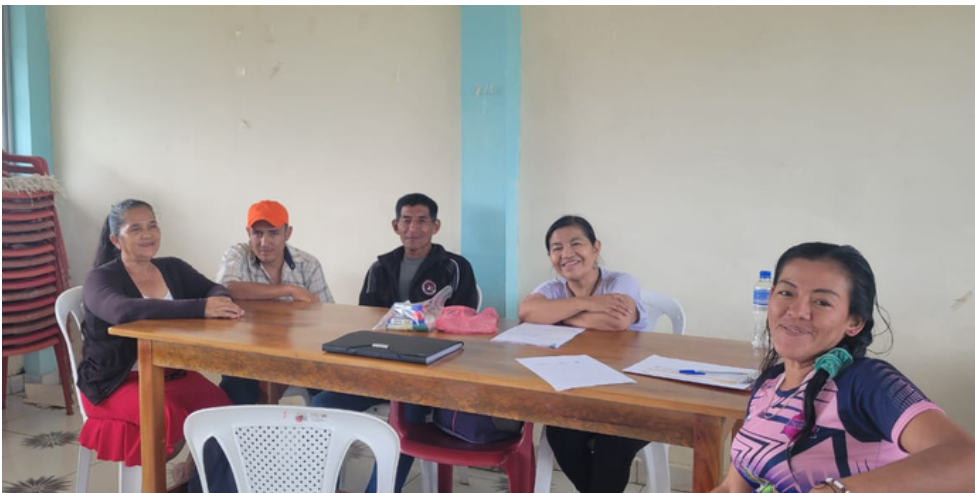
Trabajo comunitario en la comunidad de Miss Ecuador

El 17 de julio de 2023, Palma Futuro llevó a cabo el proceso de seguimiento a las propuestas orientadas a abordar aspectos sociales y productivos considerados prioritarios para el desarrollo comunitario elaboradas por los líderes y lideresas de la comunidad de Miss Ecuador , ubicada en Shushufindi, en la Amazonía ecuatoriana. De esta manera, el proyecto continua fortaleciendo las acciones y actividades lideradas por los Círculos Comunitarios para promover el cumplimiento social en las comunidades.