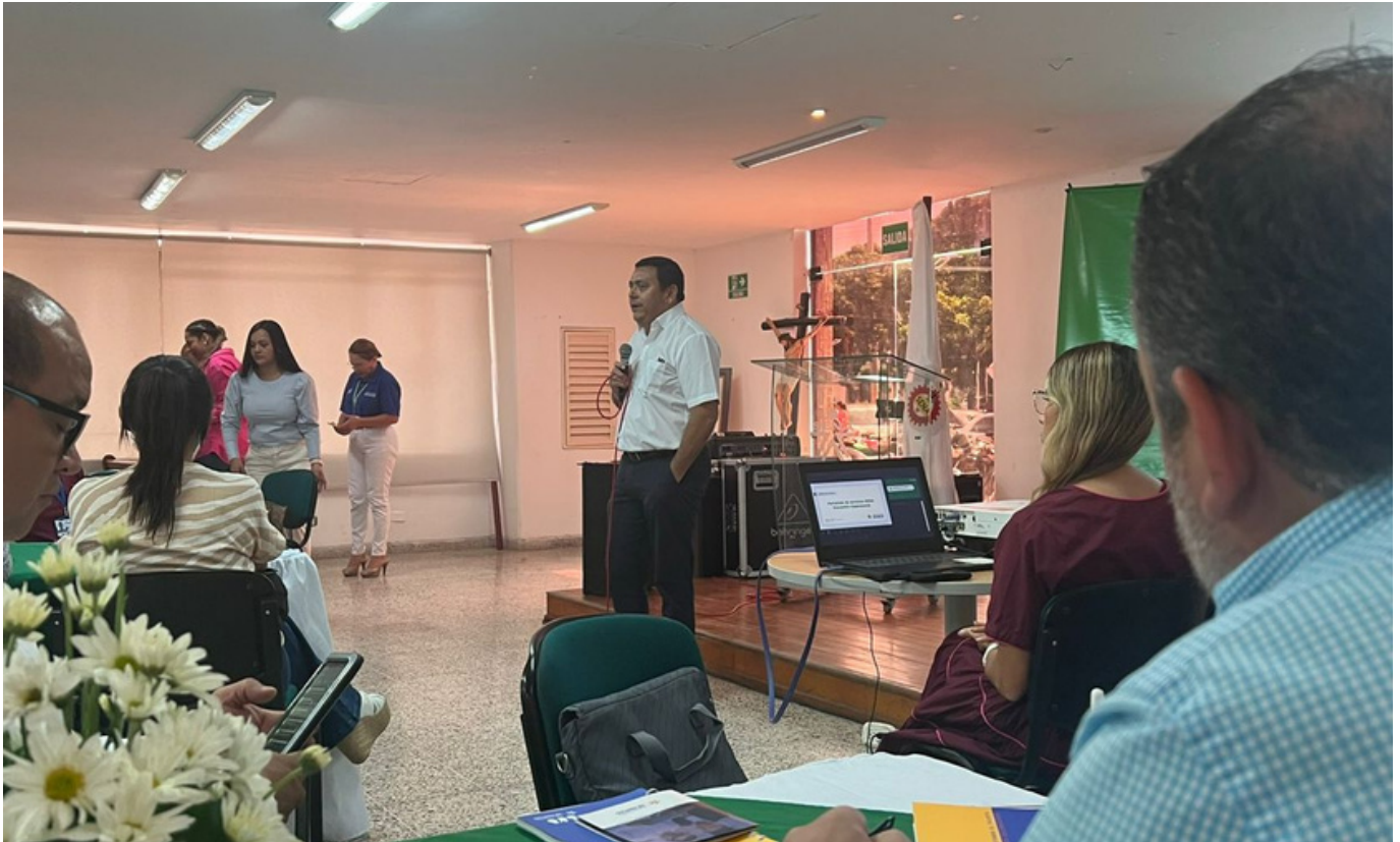
Mesa agro CampeSENA, Cesar Colombia