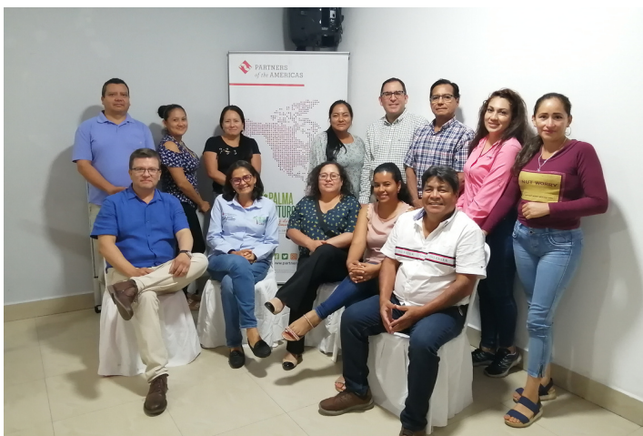
Capacitación sobre legislación laboral con el grupo Palmas Arriba