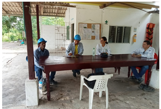
Visita de seguimiento a finca Soledad en Magdalena, Colombia