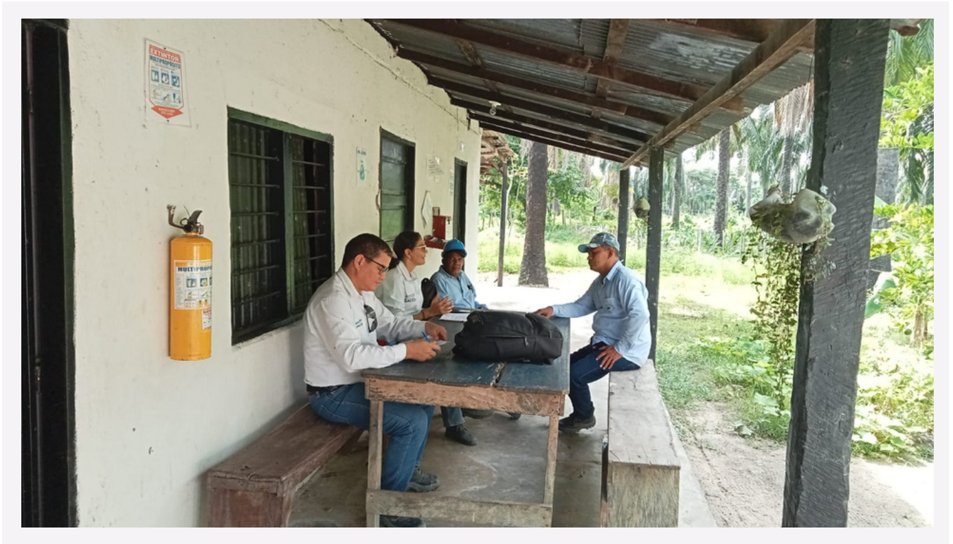
Visita de seguimiento a finca La Palestina en Magdalena, Colombia

En junio de 2023, Palma Futuro realizó visitas de seguimiento a los proveedores de Aceites y Palmaceite , en Magdalena, Colombia, y a fincas de palmicultoras pertenecientes al grupo Palmas Arriba de PROAmazonía , en Joya de los Sachas, Ecuador.