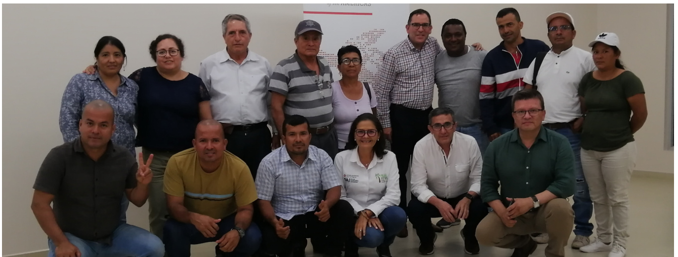
Capacitación sobre legislación laboral con afiliados a ANCUPA