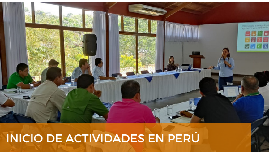
INICIO DE ACTIVIDADES EN PERÚ