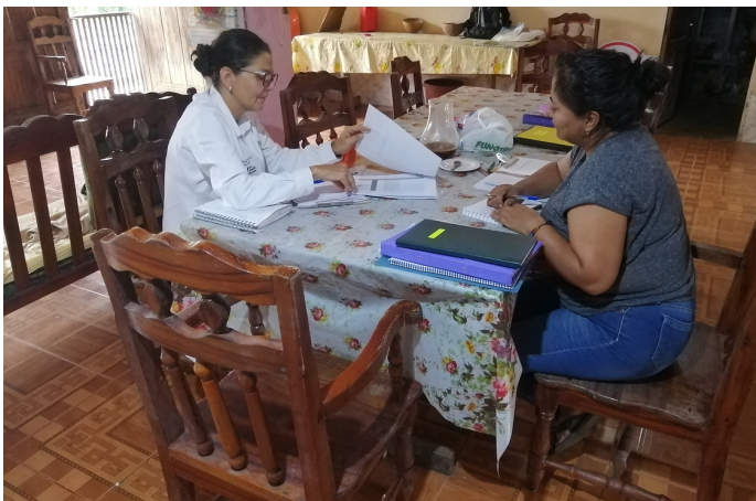
Visita de seguimiento a finca El Triángulo en Joya de los Sachas, Ecuador

El propósito de estas visitas fue documentar los avances alcanzados a la fecha frente a la implementación del Sistema de Cumplimiento Social . Durante estas jornadas se identificó el avance en los planes de acción de estos proveedores, a través de entrevistas, inspecciones visuales y revisión de registros administrativos.