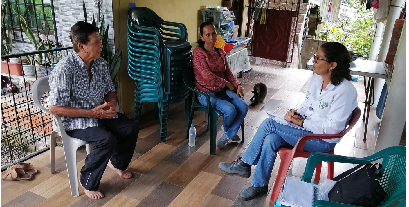
Evaluación final del Sistema de Cumplimiento Social de la Finca González

El miércoles 31 de mayo y el jueves 1 de junio de 2023, Palma Futuro realizó el proceso de levantamiento de la evaluación final del Sistema de Cumplimiento Social a 4 plantaciones del grupo Palmas Arriba ubicadas en la zona de Joya de los Sachas en la Amazonía ecuatoriana. Con esta jornada se completó el proceso de evaluación de 9 fincas de cultivadores de palma de aceite a pequeña escala. Además, se realizó el seguimiento de las acciones de mejora y fortalecimiento del grupo con miras a realizar más actividades para promover el cumplimiento social y los derechos laborales durante el próximo año.