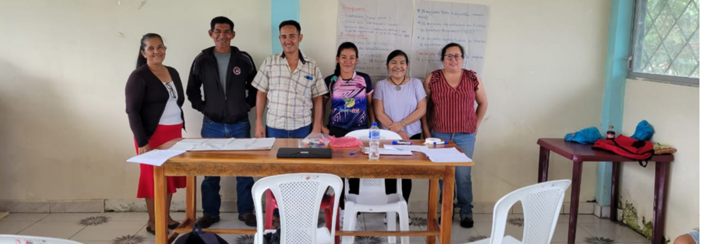
Seguimiento a elaboración de propuestas con enfoque comunitario

El 17 de julio de 2023, Palma Futuro llevó a cabo el proceso de seguimiento a las propuestas orientadas a abordar aspectos sociales y productivos considerados prioritarios para el desarrollo comunitario elaboradas por los líderes y lideresas de la comunidad de Miss Ecuador , ubicada en Shushufindi, en la Amazonía ecuatoriana. De esta manera, el proyecto continua fortaleciendo las acciones y actividades lideradas por los Círculos Comunitarios para promover el cumplimiento social en las comunidades.