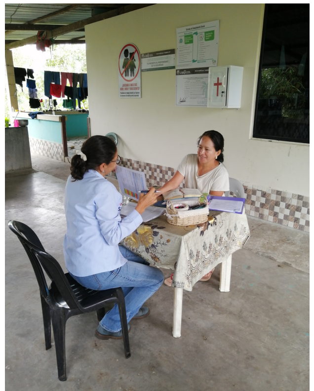
Evaluación final del Sistema de Cumplimiento Social de la Finca la Gabrielita

El miércoles 31 de mayo y el jueves 1 de junio de 2023, Palma Futuro realizó el proceso de levantamiento de la evaluación final del Sistema de Cumplimiento Social a 4 plantaciones del grupo Palmas Arriba ubicadas en la zona de Joya de los Sachas en la Amazonía ecuatoriana. Con esta jornada se completó el proceso de evaluación de 9 fincas de cultivadores de palma de aceite a pequeña escala. Además, se realizó el seguimiento de las acciones de mejora y fortalecimiento del grupo con miras a realizar más actividades para promover el cumplimiento social y los derechos laborales durante el próximo año.