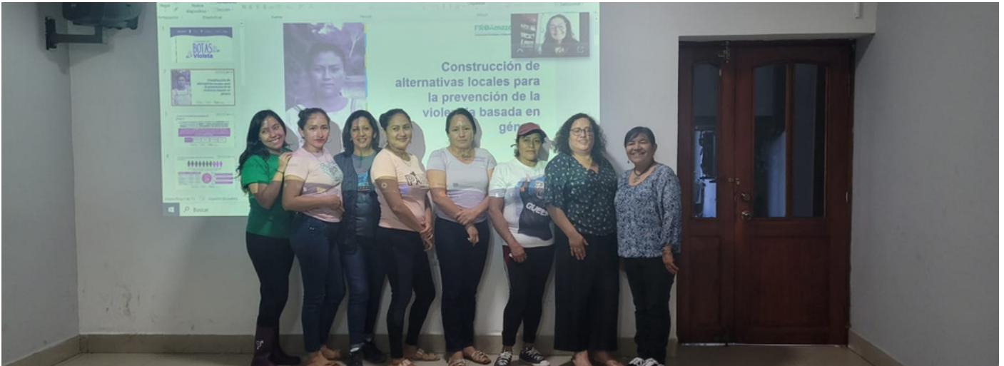
Taller sobre Prevención de violencia de género realizado por Palma Futuro y PROAmazonía