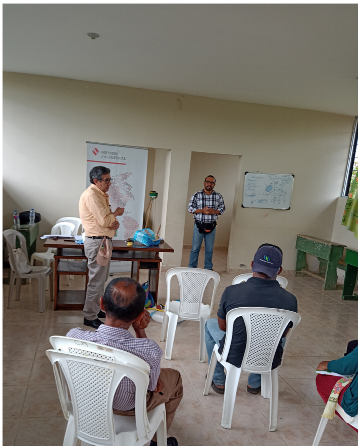
Actividad de capacitación de Palma Futuro con afiliados a ANCUPA

Palma Futuro llevo a cabo una reunión con los directivos de la Asociación Nacional de Cultivadores de Palma Aceitera (ANCUPA) de Ecuador, con el fin de abordar las actividades que se desarrollarán durante el próximo año.