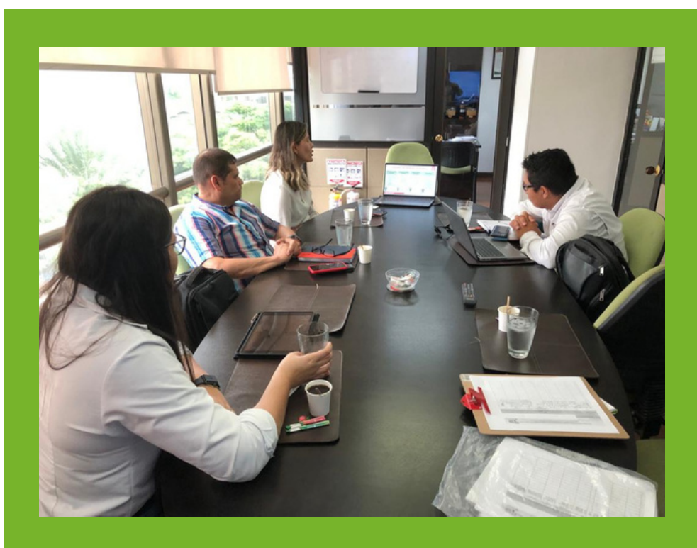
Reunión con Aceites y Palmaceite en Santa Marta, Magdalena