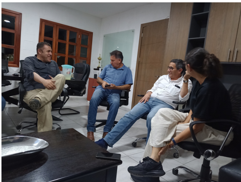
Reunión directivos de ANCUPA y Palma Futuro