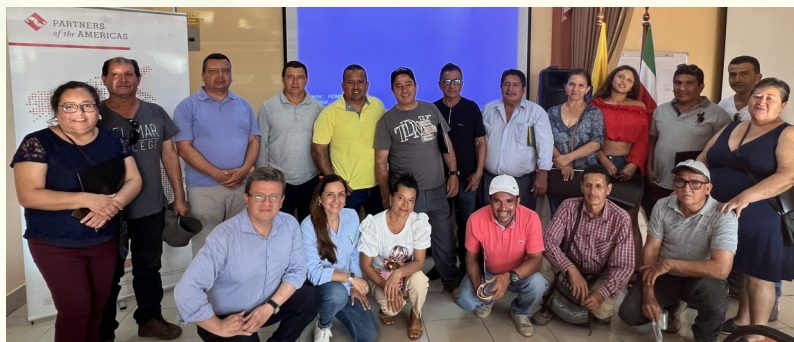
Ecuador. Taller sobre el Sistema de Cumplimiento Social con las asociaciones Palma de Oro y Palmicultores de Shushufindi