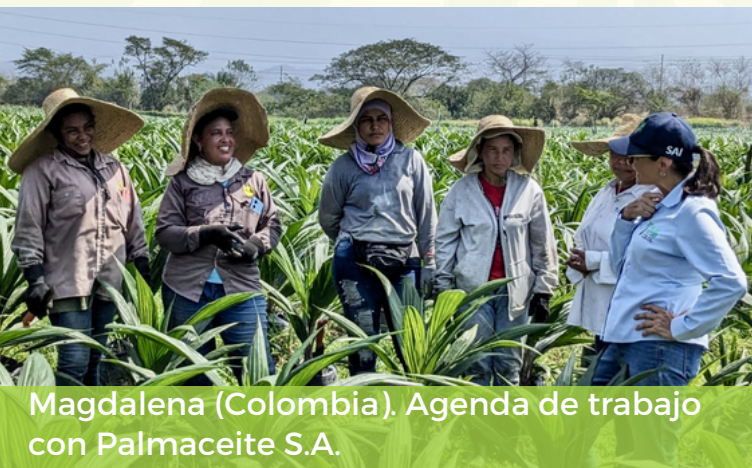
Magdalena (Colombia). Agenda de trabajo con Palmaceite S.A.