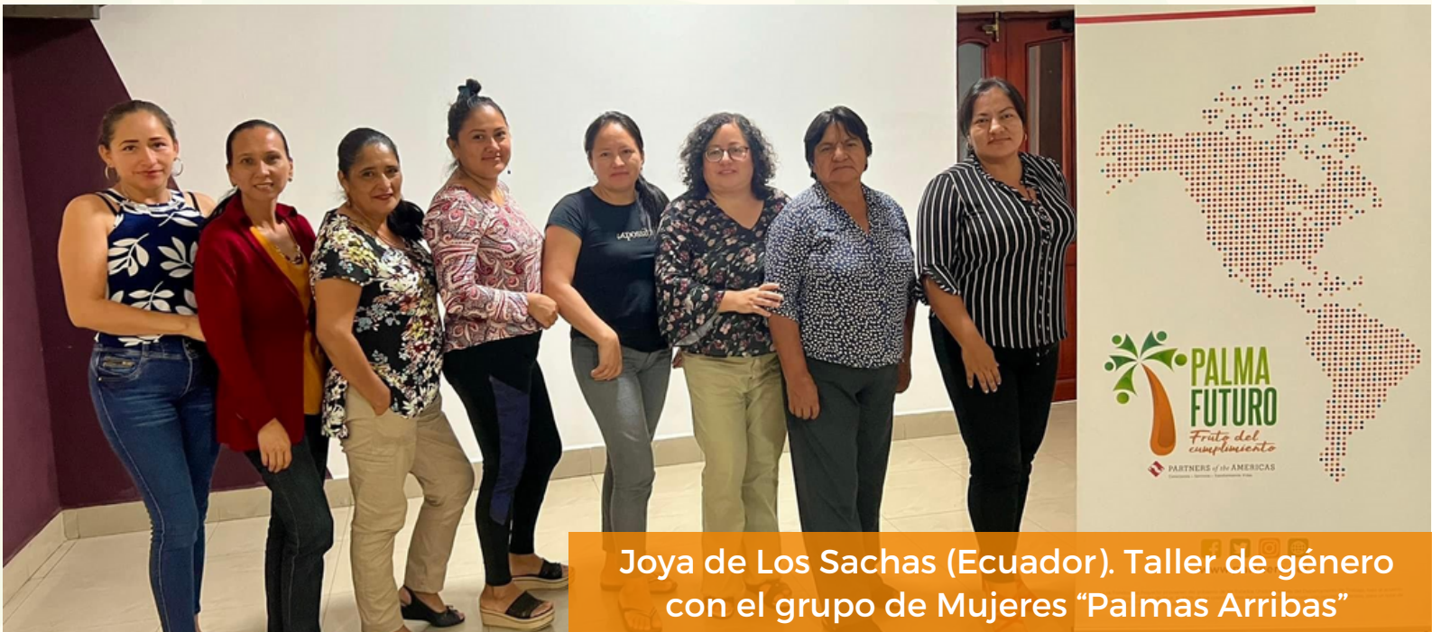
Joya de Los Sachas (Ecuador). Taller de género con el grupo de Mujeres "Palmas Arribas"