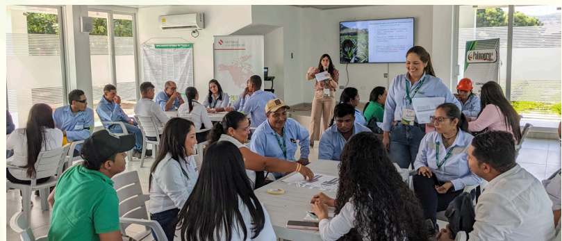
Taller en promoción de la equidad de género en Palmagro