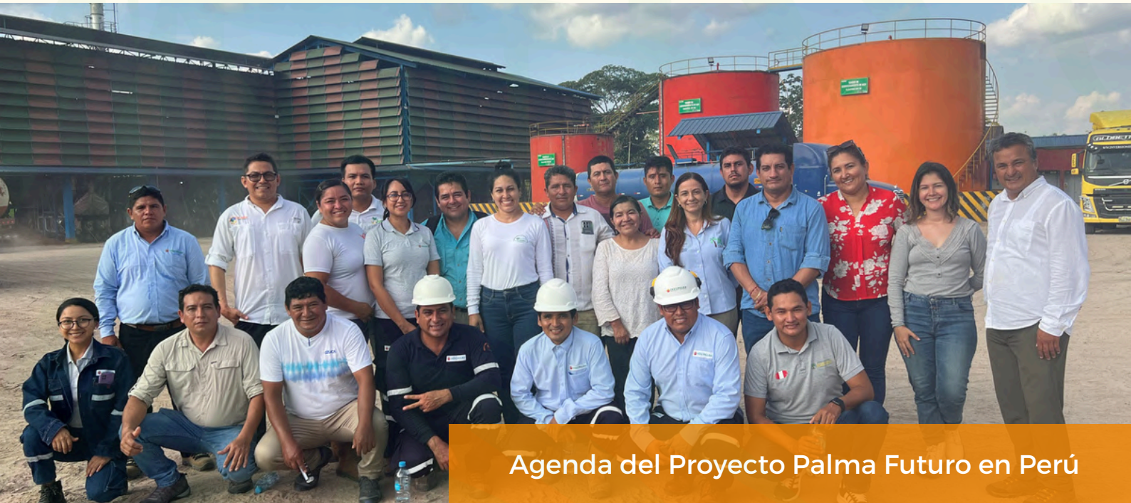
Agenda del Proyecto Palma Futuro en Perú