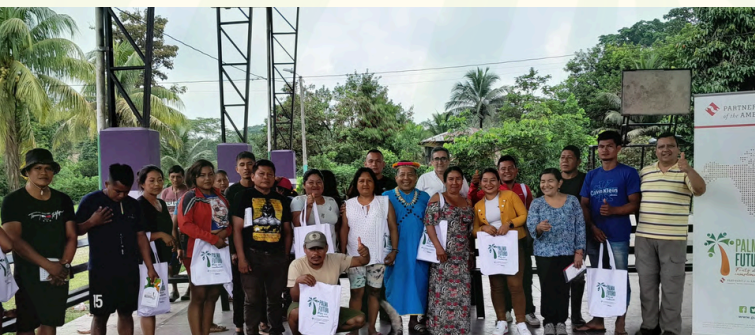
Capacitación a la Comunidad Indígena Siekopai en Shushufindi